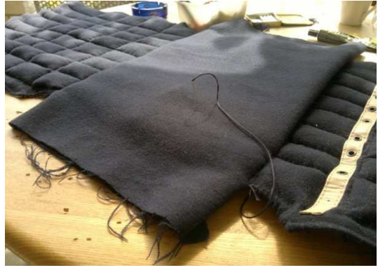
Aufnähen zusätzlicher Schulterverstärkung.