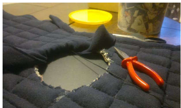
Nähen der Randeinfassung für den Halsausschnitt.