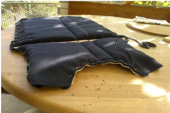
Eingefasst mit Stecknadeln...