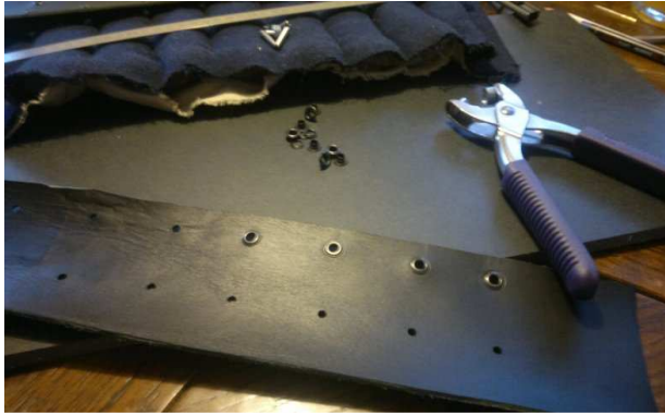
Herstellen der Randeinfassung aus Leder für unten.