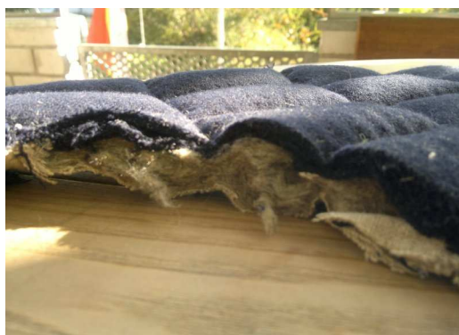
Rand ohne Einfassung.

Fotos in loser Reihenfolge, welche die Herstellung dokumentieren.