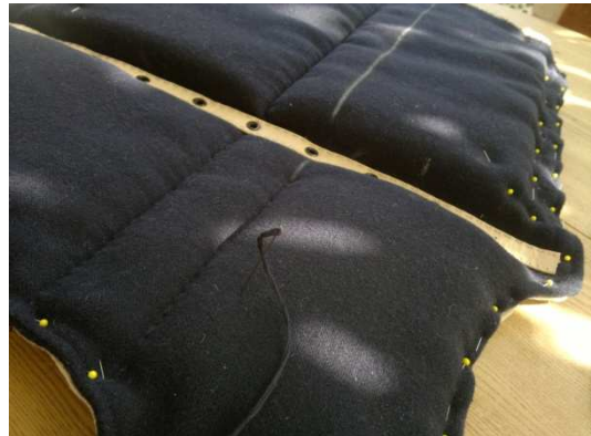
Erste handgenähte Senkrechtesteppung.

Dieses Dokument ist nur als Anregung zu sehen um sich seine persönliche Subarmalis zu bauen. Ich erhebe keinen Anspruch auf absolute Authentizität!